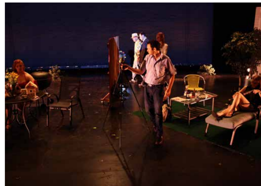
William Leavitt, Habitat at The Kitchen, New York, 2013.

MC: Is post-performance a new label for this new generation? What are the criteria?