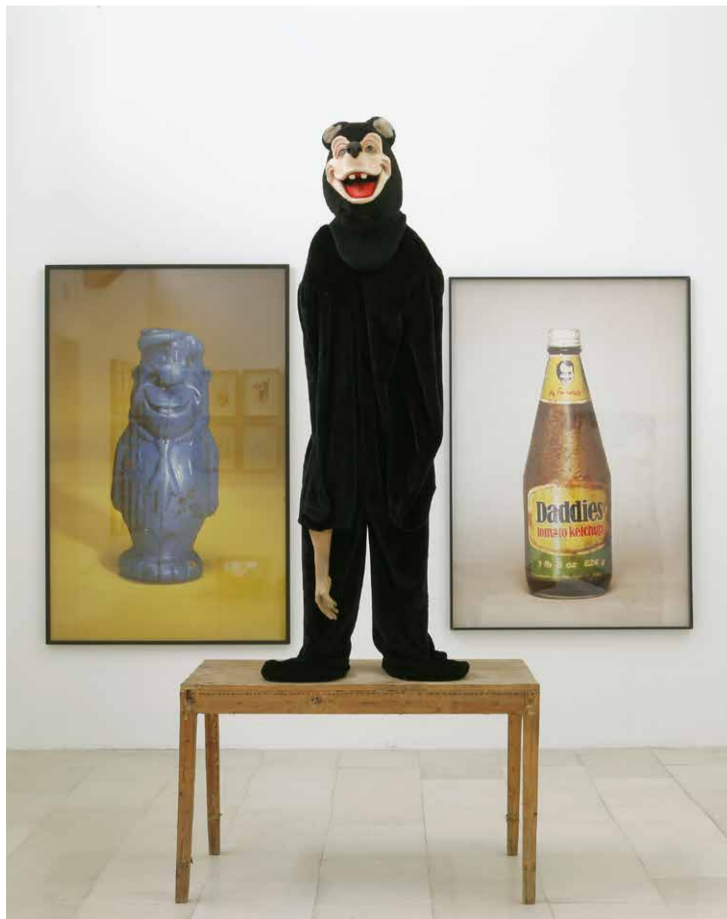
Paul McCarthy, from left to right - Propo (Fred Elinstone), Skinny Bear, Propo (Daddy's Ketchup). All works: 1992, installation view of "Do Not Play With Dead Things" at Villa Arson, Nice, 2008.

that the creative impulse draws on sexual roots. It means subverting the good conscience that comforts the domestic universe, showing that behind the closed doors of aseptic homes, reality outdoes fiction. So camp, in its use of exaggerated feminisation and distortion of habits and manners, reveals a part of what can often exist behind the stage—such as the perfect middle class house as the artificial façade. For some artists, the theatricality stems from the physical context of the work.